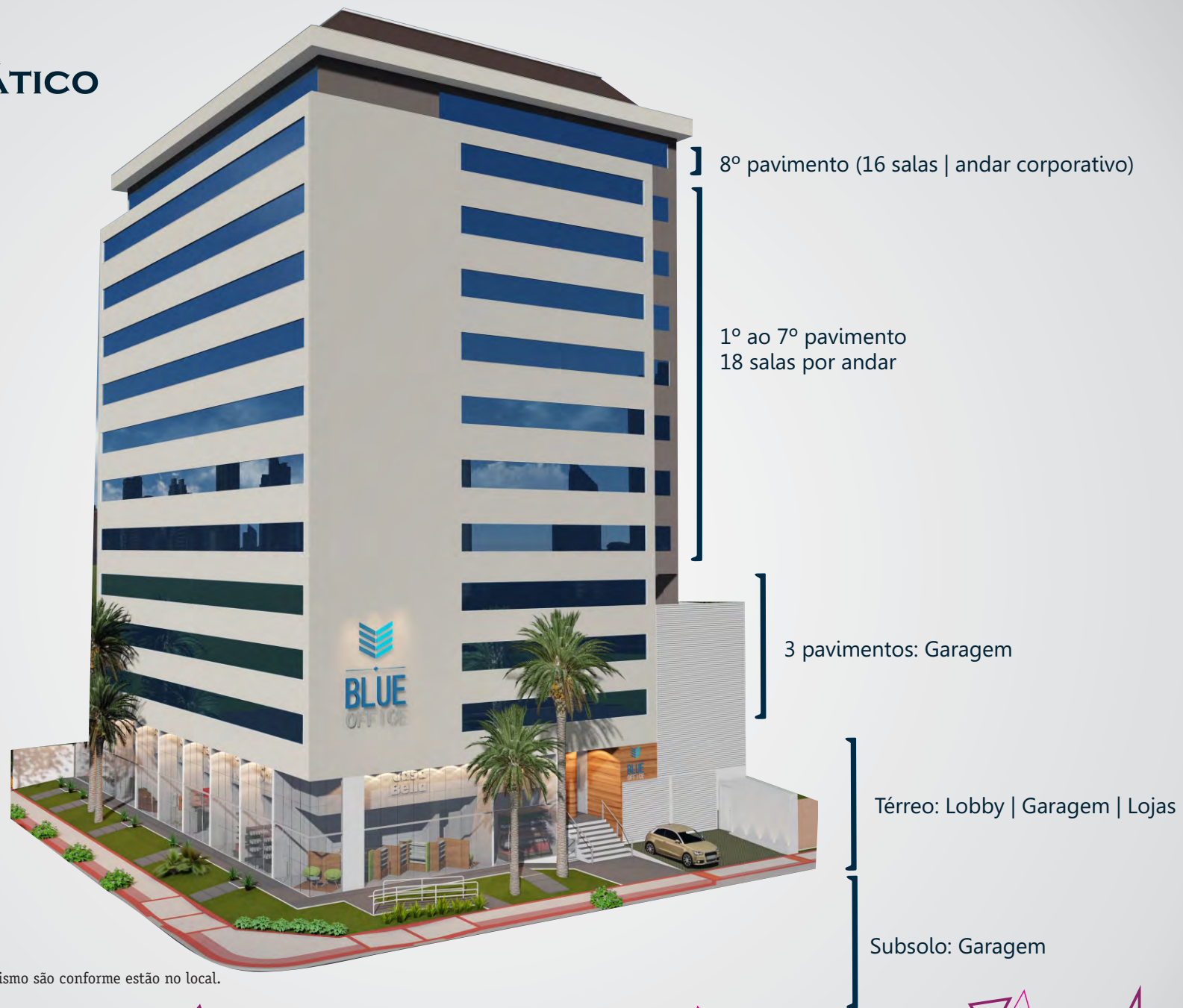
Imagem meramente ilustrativa, os acabamentos e paisagismo são conforme estão no local.