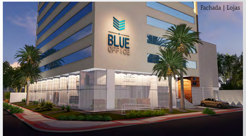
Fachada | Lojas

Imagem meramente ilustrativa, os acabamentos e paisagismo são conforme estão no local.