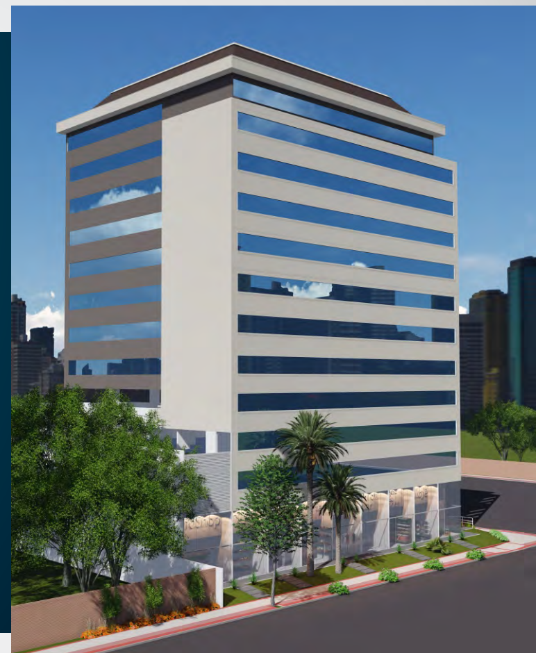
Imagem meramente ilustrativa, os acabamentos e paisagismo são conforme estão no local.